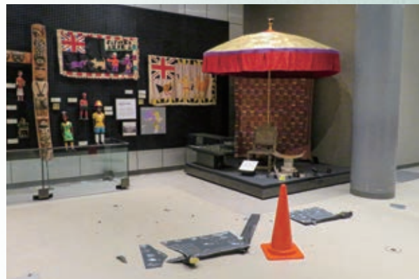
天井パネルの落下