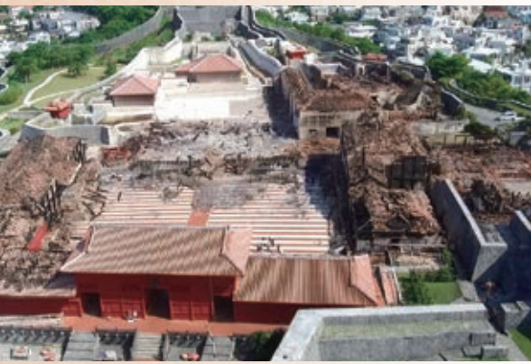
火災後の首里城全景