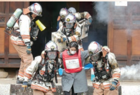
文化財社寺における救出救護訓練